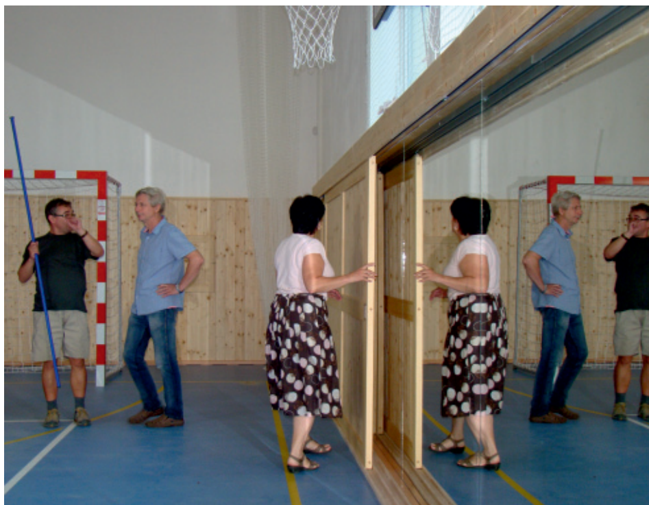
Bohdíkovská škola se dočkala tělocvičny, kterou využije celá vesnice. Navíc díky nové kmenové učebně může přijmout více žáků.

Celkově projekt na rozšíření výukových kapacit v Bohdíkově čítal téměř 24 milionů korun, z toho dotace od ministerstva školství činila 15,6 milionu korun. Finance na realizaci získala obec z Ministerstva školství, mládeže a tělovýchovy České republiky v rámci programu Rozvoj výukových kapacit mateřských a základních škol zřizovaných územně samosprávnými celky. Obec projekt realizovala ve spolupráci s Místní akční skupinou Horní Pomoraví.