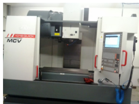
CNC fréza pořízená z minulého dotačního období.

Příjem žádostí o dotace bude probíhat od 9. do 23. ledna 2018 v kanceláři v Hanušovicích. Informace o vyhlášené výzvě a jednotlivých opatřeních naleznete na webu