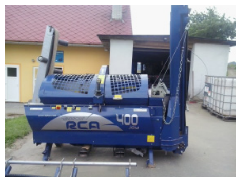
Štípač dříví pořízený z minulého dotačního období.

dování odpočinkových míst a stezek na lesních pozemcích, zde mohou o dotaci požádat například i obce či neziskové organizace. „V první výzvě v květnu letošního roku získala dotaci na vybudování naučné stezky Charita Zábřeh. V průběhu roku 2018 se tak mohou nejen turisté, ale i místní těšit na odpočinková místa a naučné tabule na turistické trase v údolí Moravské Sázavy ze Zábřeha do Lupěného,“ dodala Baslerová.